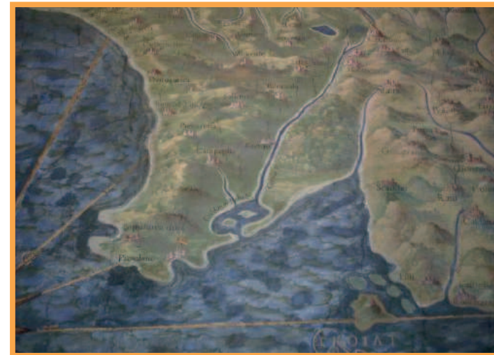
Affresco Musei Vaticani